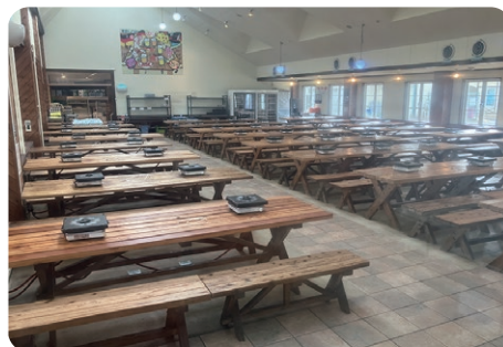
屋内スペース 一般、団体共用