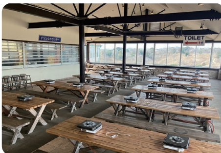
Dテラス 一般、団体共用