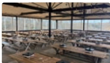
団体専用スペース 100名様～目安