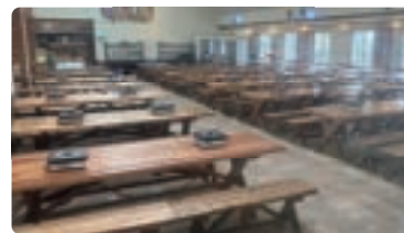
屋内スペース 一般、団体共用