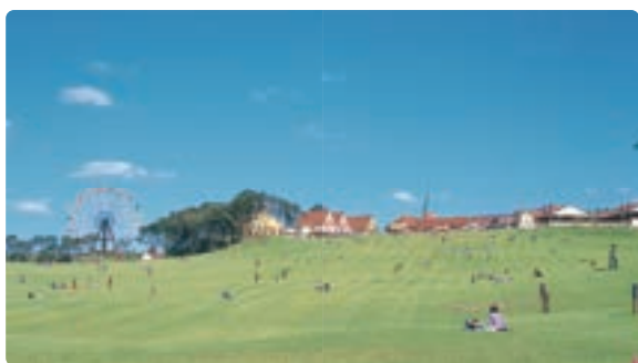
芝生広場 園内中央

※飲食店舗への食品の持ち込みはできません。 ※持ち込みのお弁当のゴミはお持ち帰りをお願いします。