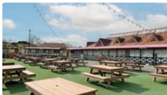
フードテラス マーケットエリア

※飲食店舗への食品の持ち込みはできません。 ※持ち込みのお弁当のゴミはお持ち帰りをお願いします。