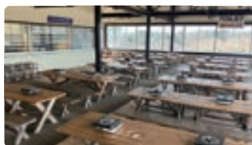
半屋外スペース 一般、団体共用